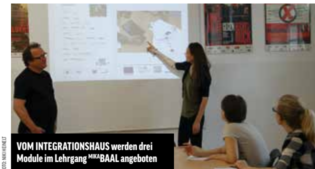
VOM INTEGRATIONSHAUS werden drei Module im Lehrgang MIKA BAAL angeboten

Die Weiterentwicklung fachlicher Inhalte macht das Integrationshaus nicht im Alleingang, sondern in 4 Kooperationsprojekten gemeinsam mit vielen anderen Organisationen. Der große Vorteil dieser