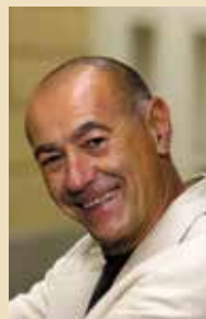
WILLI RESETARITS ist Gesangskünstler und Mitbegründer des Integrationshauses

Unser Bild ist ein ganz anderes! Wir kennen viele der Menschen, die nach Österreich geflüchtet sind. Aus Angst vor Verfolgung, vor Krieg, vor dem Tod. Die zu uns kommen, weil sie Hilfe brauchen.