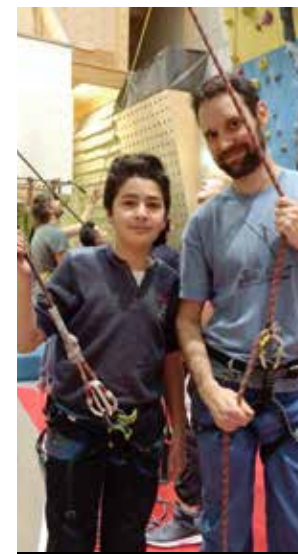
KLETTERN stärkt das Selbstvertrauen der Kids und hilft dabei, Verantwortung für sich und andere zu übernehmen.

EIN STARKER präventiver Ansatz in sozialpädagogischen Einrichtungen für unbegleitete Minderjährige braucht Ressourcen wie pädagogisch gut ausgebildete Mitarbeiter*innen, einen hohen Betreuungsschlüssel und kleine Wohngruppen. Gruppen mit mehr als 10 Jugendlichen sind pädagogisch schwer überschaubar und steuerbar, auch